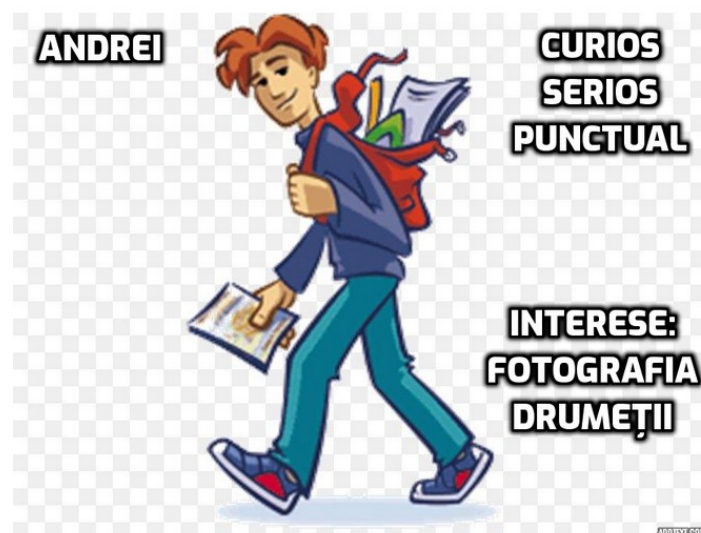
Figura 3. Exemplu de prezentare cu ajutorul aplicației Addtext